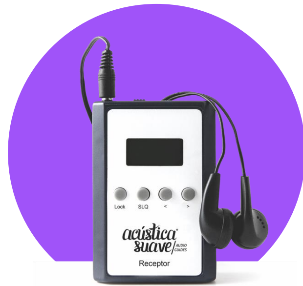
Навушники та аудіогід