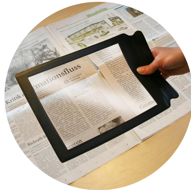
Прилад для читання плоскодруктованих текстів