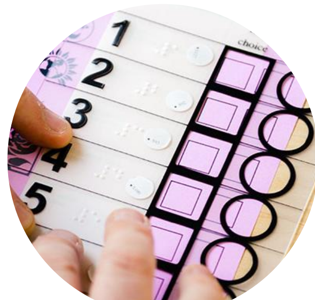
Накладки на бюлетень з шрифтом Брайля