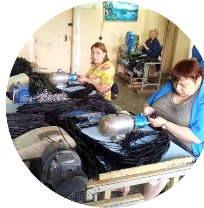
Виробництво при УТОС в Україні