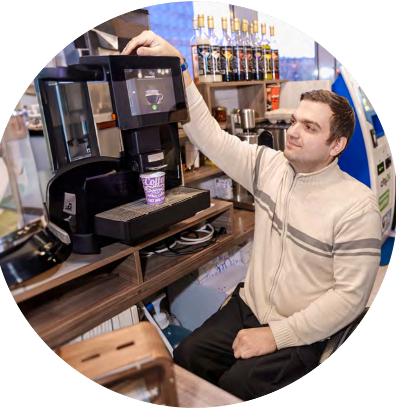
Людина на кріслі колісному працює у кав'ярні