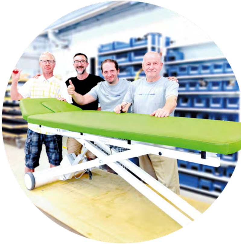
Приклад виробництва у німецькому місті-побратимі Карлсруе